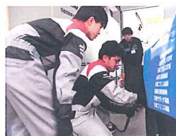
決勝以外はレーシングカーのタイヤ交換も任せられる。学生にとっては緊張の連続だ